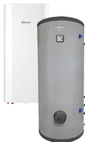
Комбинированные (косвенные) водонагреватели