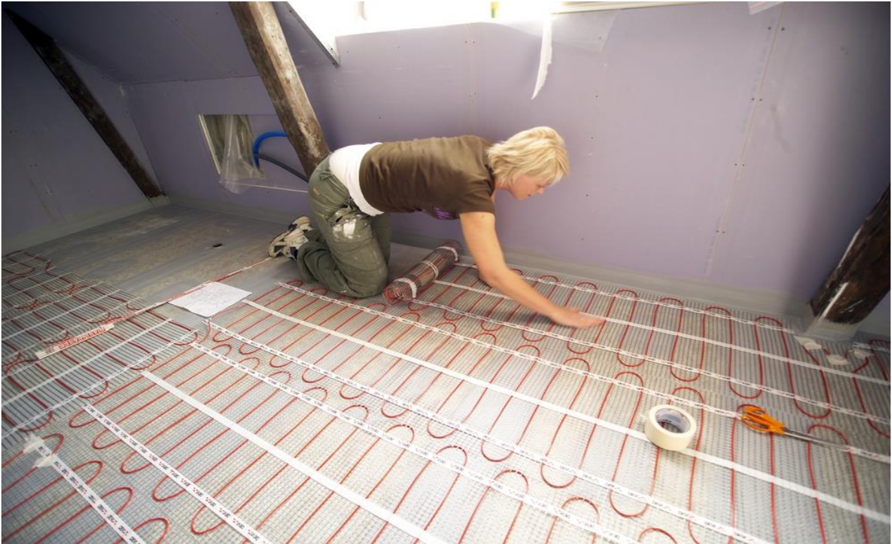
Рис. 3. Монтаж нагревательного мата DEVIheat™ 150S (DSVF-150) на основание из плит ГВЛ под плитку.

При выборе нагревательных матов необходимо учитывать допустимый разброс параметров, приведенных в технических характеристиках, и возможные отклонения напряжения питающей сети.